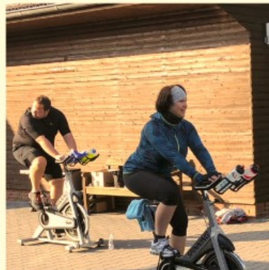
Halloween Eventride im Bewegungsraum!